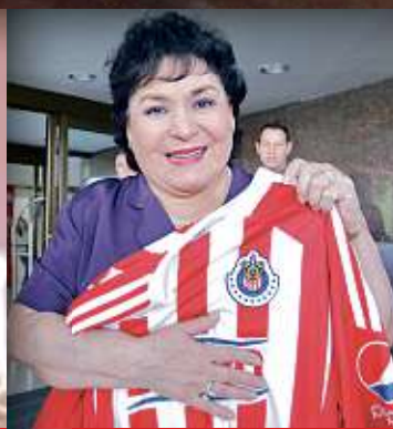
■ Carmen Salinas actuó en "Mi Corazón Es Tuyo", es la reina de los memes y Chiva de corazón.